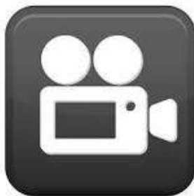
Vin Butera Video